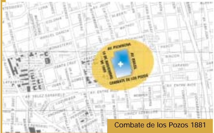
Combate de los Pozos 1881