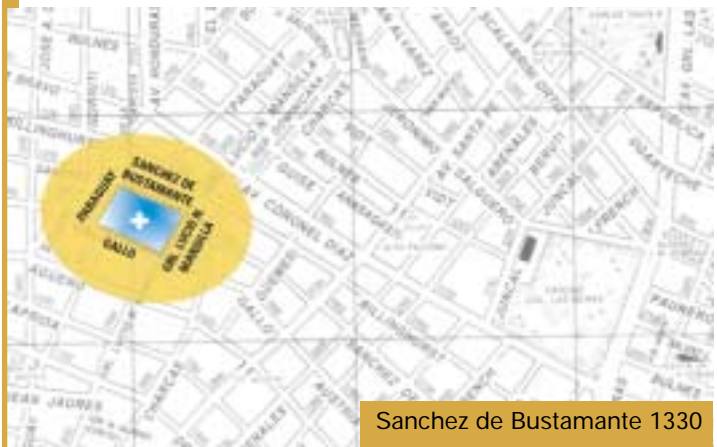
Sanchez de Bustamante 1330